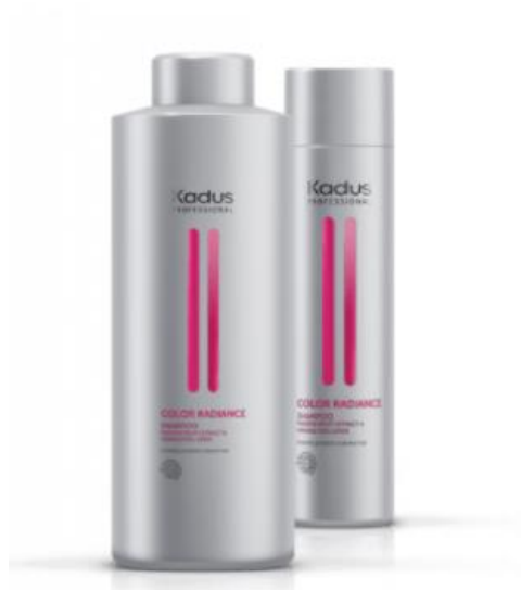
Color Radiance - Shampooing