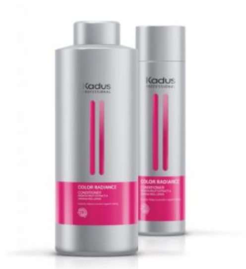
Color Radiance – Conditionneur