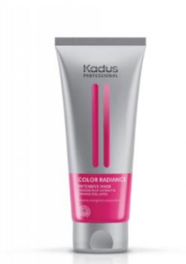
Color Radiance – Masque