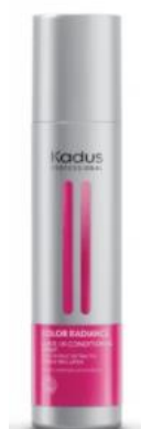
Color Radiance – Conditionneur sans rinçage