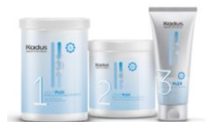
Gamme de décoloration - Lightplex