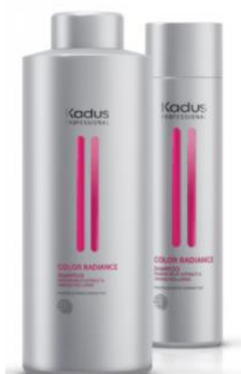
Color Radiance – Shampooing