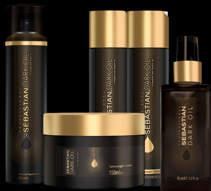
Dark Oil with DiffusX technology