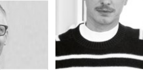
Matthias Scharf @matthiasscharf