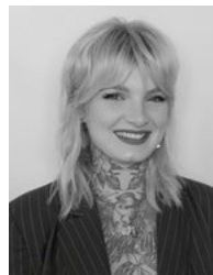
Samantha Schüller @samantha.schuessler