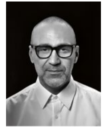
Bertram Kainzer @bertram_k