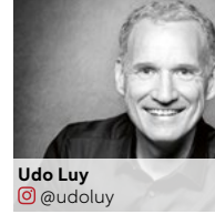
Udo Luy @udoluy