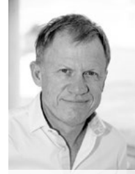
Markus Droste @markusdroste64