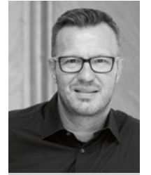
Thomas Esche @esche.thomas