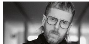
Pierre Heinemann @pierre_heinemann_photography