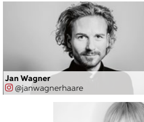
Jan Wagner @janwagnerhaare