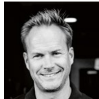
Hannes Steinmetz @steinmetz.bundy