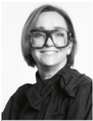
Jutta Gsell @kopf_kunst