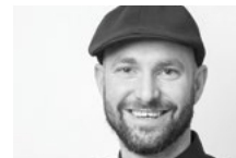
Marco Kùveler @marco_kueveler