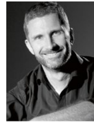
Andreas Paischer @friseurpaischer